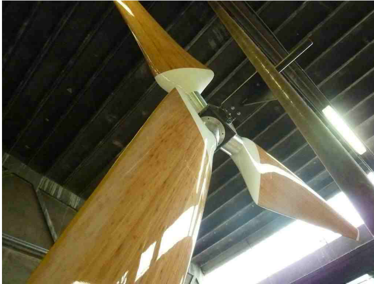
Rotore eolico in materiale biocomposito premontato in officina

L'utilizzo di fibre naturali, oltre che apportare indubbi ed oggettivi vantaggi sotto il profilo ecologico, consente di ridurre drasticamente l'impatto ambientale di queste turbine anche sotto il profilo della visibilità. Come è noto, infatti, gli impianti eolici determinano un impatto sull'ambiente soprattutto dal punto di vista dell'occupazione del territorio e della variazione al paesaggio. L'ubicazione degli impianti eolici richiede siti particolarmente esposti e pertanto questi impianti risultano generalmente molto visibili.