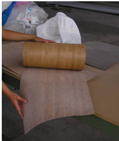
Fogli di bambù

Con il termine biocomposito viene indicato un materiale composito nel quale almeno uno dei costituenti principali derivi da risorse rinnovabili la cui peculiarità è quella di poter essere facilmente ripristinate senza provocare un impoverimento delle materie prime e dell'energia disponibili in natura. Esistono delle procedure standardizzate a livello internazionale che permettono di quantificare e valutare i danni ambientali derivanti dalla realizzazione di un prodotto o dalla fornitura di un servizio. Applicando tale