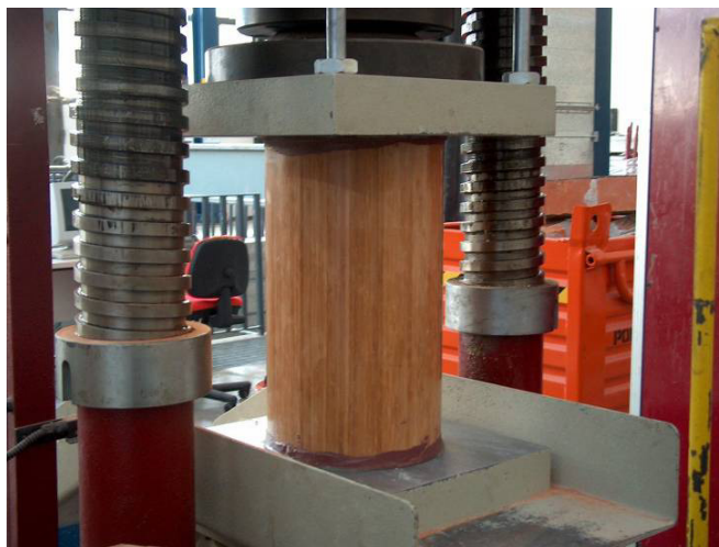
Prove di buckling

metodo di valutazione ad un materiale composito tradizionale (fibre di vetro/carbonio in resina epossidica) e ad un materiale biocomposito (fibre naturali in resina epossidica) è stato possibile confrontare oggettivamente i carichi ambientali derivanti dall'impiego di ciascuno di essi durante tutto il ciclo di vita.